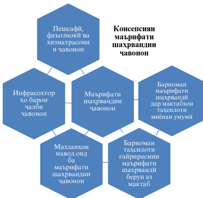
Нақшаи 1. Қисмҳои таркибии системаи маърифати шаҳрвандии ҷавонон

Ҳар унсурҳои ташкили ҷараёни маърифати шаҳрвандии ҷавонон дорои мақсад, вазифа ва натиҷаҳои ниҳой буда, дар якҷоягӣ ин ҷараёнро ба системаи том табдил медиҳанд. Дар ҷадвали поён мақсад, вазифа ва натиҷаҳои ниҳойи унсурҳои мазкурҳои системаи маърифати шаҳрвандии ҷавонон тафсир мегарданд.